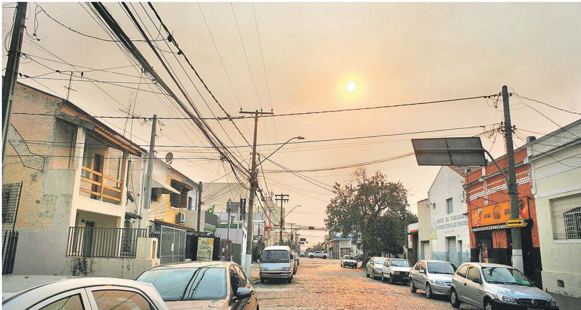
Expectativa é que pancadas de chuva aliviem o tempo seco e melhorem a qualidade do ar, muito afetada pelas queimadas que assolaram todo o Estado de São Paulo na última semana

"Essas amplitudes térmicas causam bastante danos à saúde, por isso é importante se proteger. Existe ainda a perspectiva de que o tempo seco persista, então mesmo com o frio as pes-